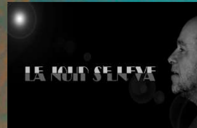
IL Y A SÛREMENT